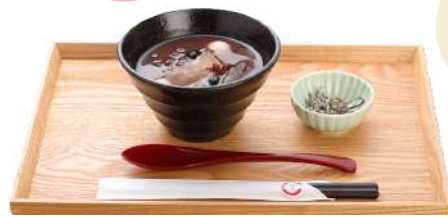
手作りわらびもち入 ぜんざい (温・冷)