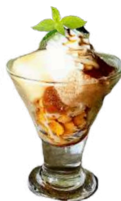
バニラ キャラメル