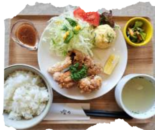
ハーフ からあげ定食 ¥830