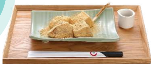
手作りわらびもち