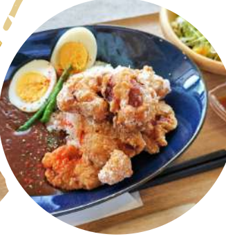
メガからあげカレー ¥1,300