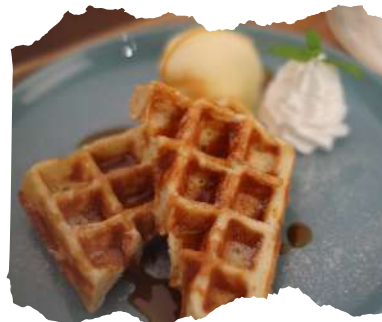
バニラキャラメル