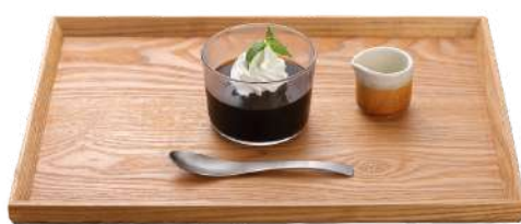
萩原珈琲豆の コーヒーゼリー