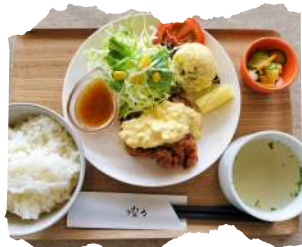
ハーフ チキン南蛮定食 ¥830